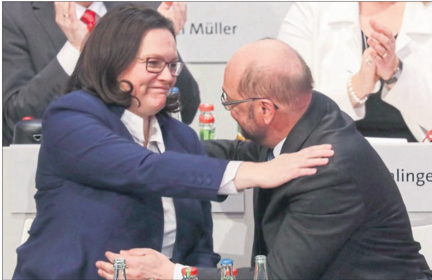
Erleichtert über knappen Erfolg: Die SPD-Fraktionsvorsitzende Andrea Nahles und der SPD-Parteivorsitzende Martin Schulz umarmen sich beim SPD-Sonderparteitag. Von 642 abgegebenen Stimmen entfielen 362 auf Ja und 279 auf Nein. Es gab eine Enthaltung.